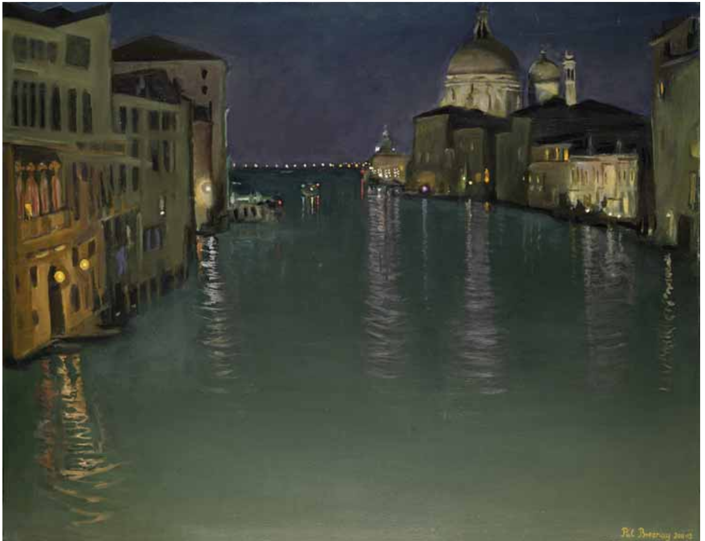
Nuit sur le Grand canal (Venise) 2011-2012 Huile sur toile 89x116 cm