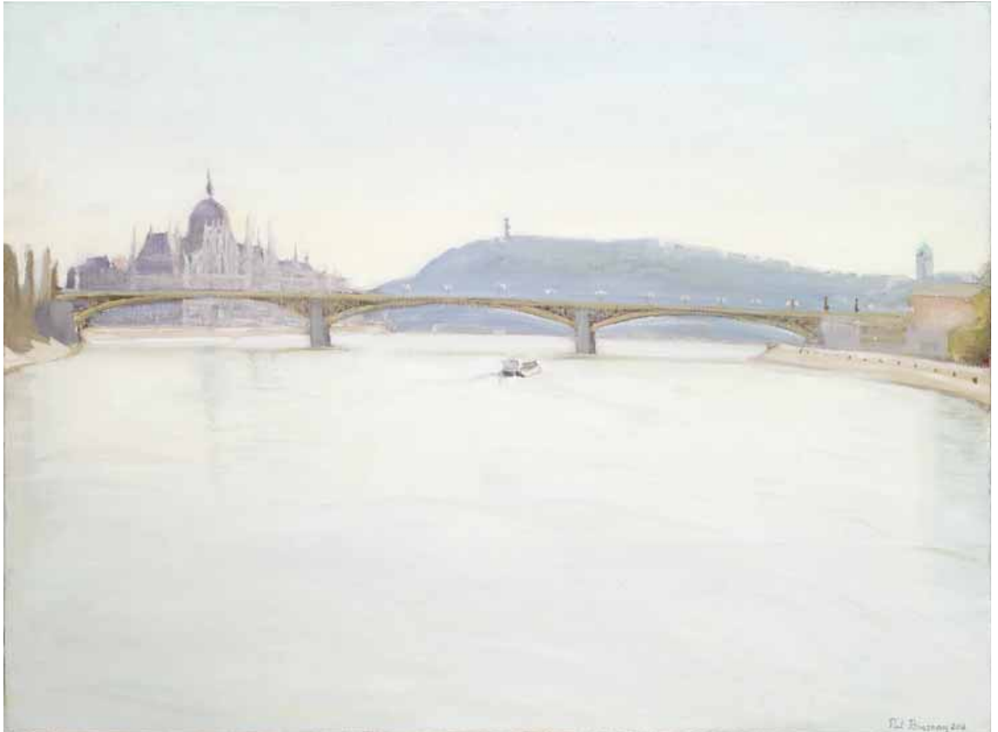
Pont Marguerite, Budapest 2011-2012 Huile sur toile 54x73 cm