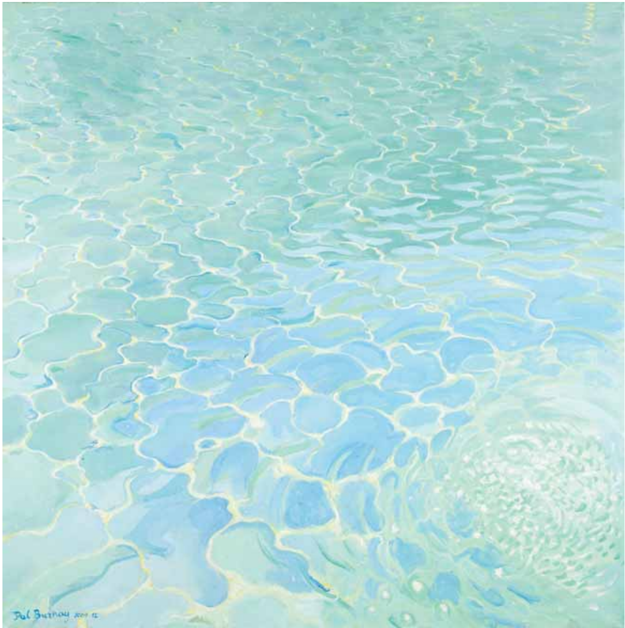
Reffet solaire 2009-2012 Huile sur toile 100x100 cm