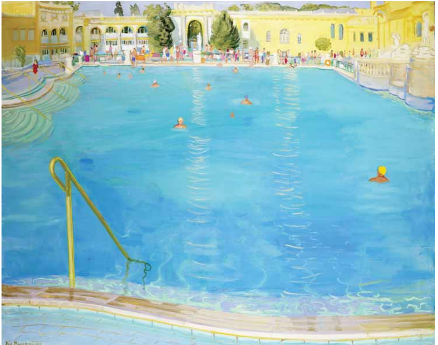
La grande bleue 2009-2012 Huile sur toile 122x153,5 cm