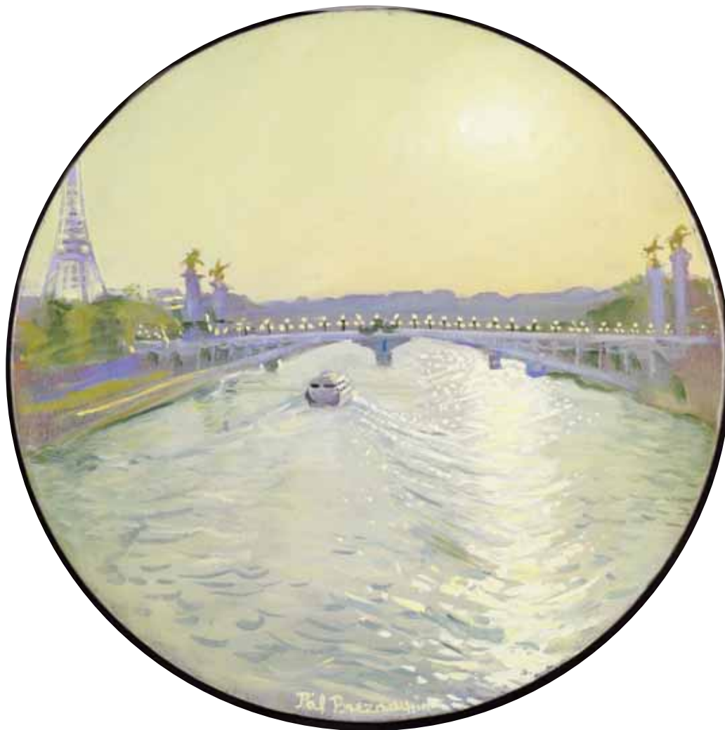
La Seine à contre-jour 2011-2012 Huile sur toile 40 cm Ø