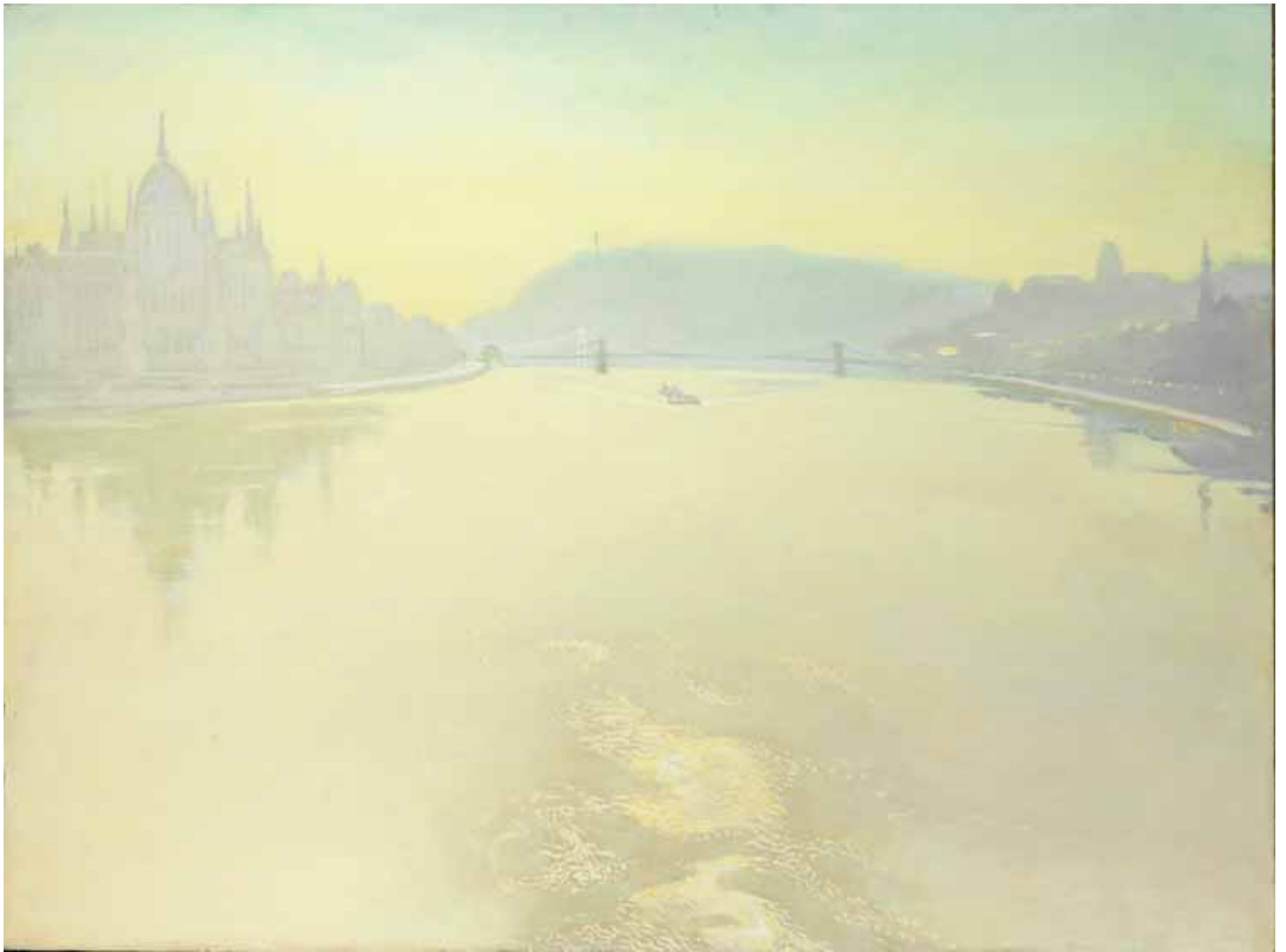
Le Danube dans le brouillard à Budapest 2011-2012 Huile sur toile 97x130 cm