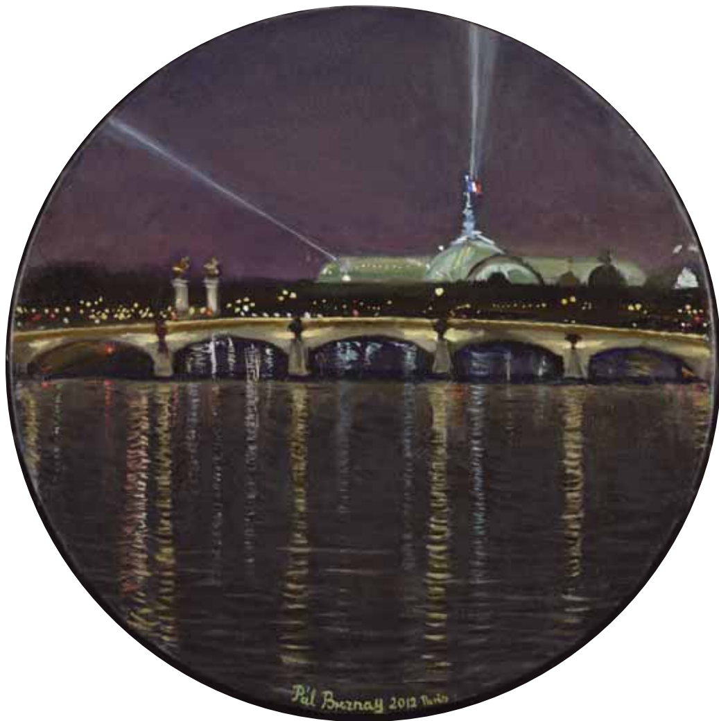
Le Grand Palais, nocturne 2012 Huile sur toile 40 cm Ø