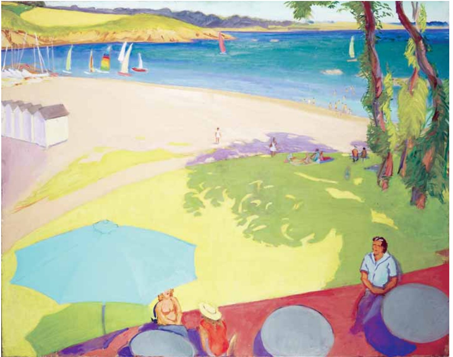
La Chataigneraie, Plage de Port-Manech, Bretagne 2012 Huile sur toile 116x146 cm