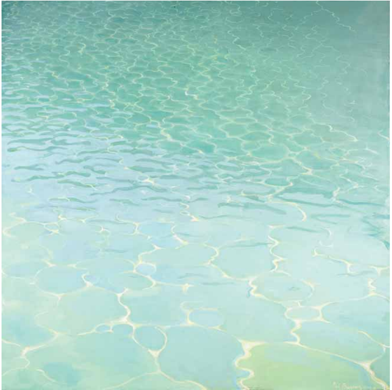
Reflets en diagonale 2008-2012 Huile sur toile 150x150 cm