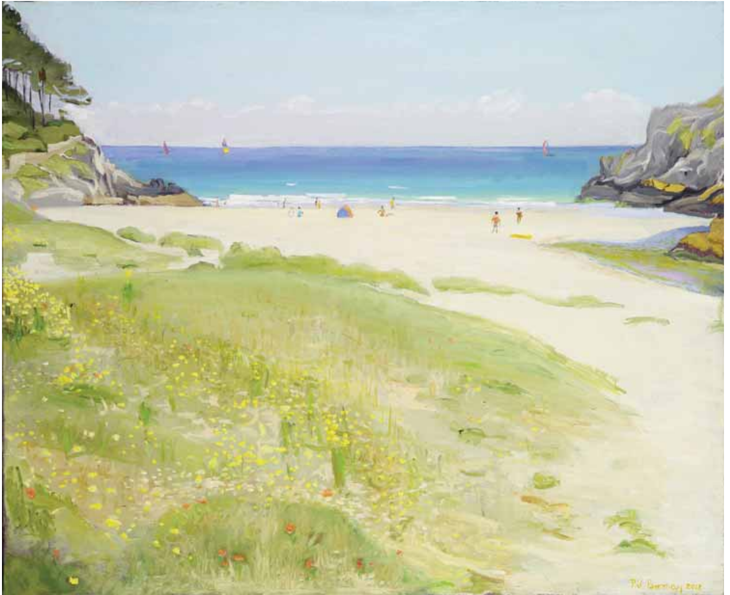
L'anse de Rospico, Bretagne 2012 Huile sur toile 60x72,5 cm