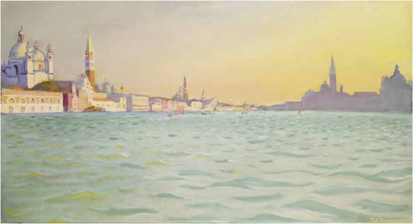
Lever du soleil à Venise 2011 Huile sur toile 54x100 cm