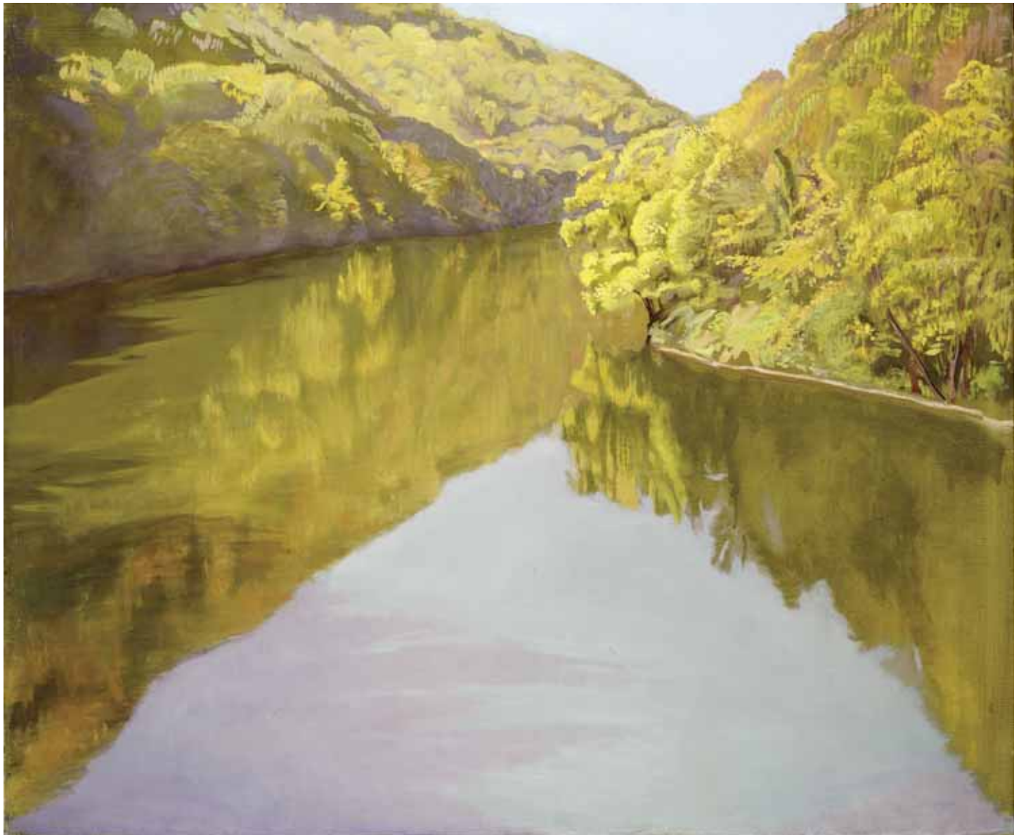
Lillafüred en automne 2011-2012 Huile sur toile 107x130 cm