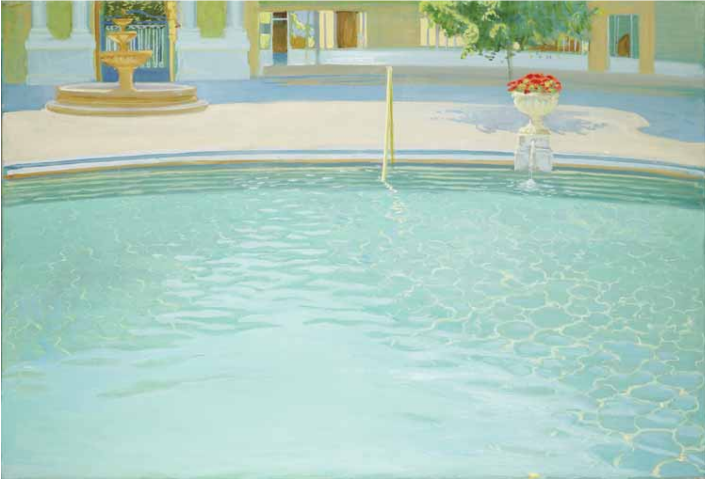
Fontaine aux bains Széchenyi 2007-2012 Huile sur toile 86,5x126 cm