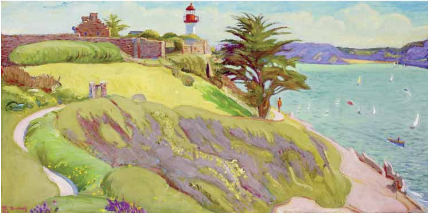
Le phare de Port-Manech, Bretagne 2012 Huile sur toile 35x70 cm