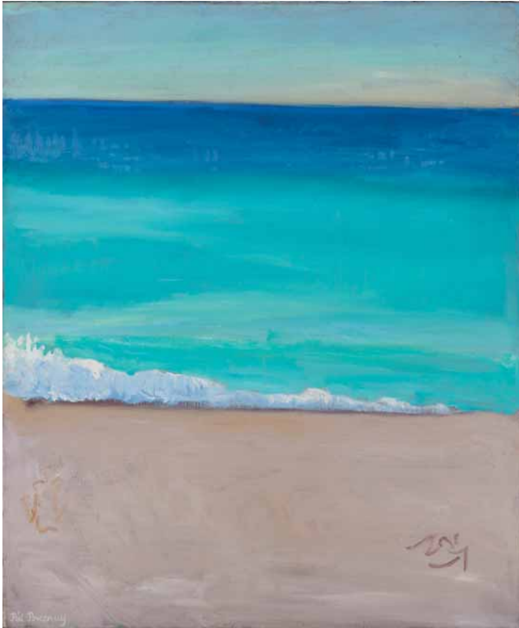
Cote d'azur 2010 Huile sur toile 65x34 cm